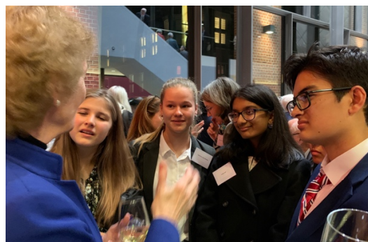
Mrs. Robinson in gesprek met jongeren uit de VS

November/December: Samenwerking met het Nationaal Bahá'í Centrum ter voorbereiding van een vredesconferentie in 2020. Benadering van Tweede Kamerleden over kernontwapening.