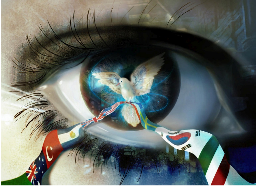
My dream of world peace ©2009 Matthew Vincentius Courtesy of DeviantArt